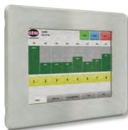
Die RHINO-Touchscreen mit dem Bedienfeld