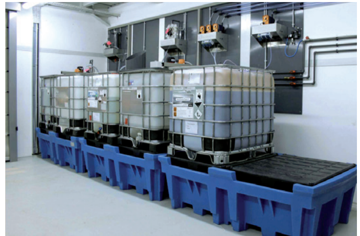
Safe and clean chemical handling Sauberes und sicheres Chemiehandling